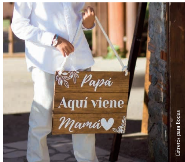
Letreros para Bodas

Por otro lado, los pequeños ramos en las esquinas de los bancos o de las sillas, e incluso pequeños cestos con flores, o por ejemplo ramas de olivo en el pasillo harán que el recorrido sea maravilloso e inolvidable.