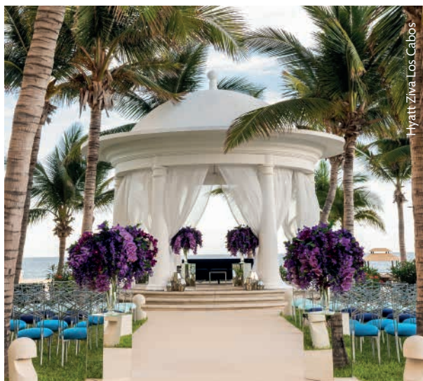
Hyatt Ziva Los Cabos

Pero te has preguntado alguna vez ¿qué es lo que no puede faltar en tu camino al altar?