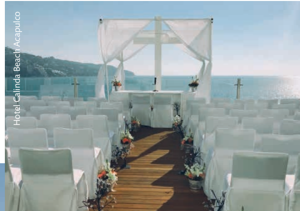
Hotel Calinda Beach Acapulco

Está claro que el día de tu boda será importante, pero el momento de la entrada a la iglesia o al lugar donde se celebre la ceremonia será uno de los instantes más especiales. Por eso es imprescindible que no falte nada de lo planeado y que todo esté cuidado hasta el más mínimo detalle. Las flores serán, seguramente, un factor importantísimo en la decoración y es que no hay pareja que se resista a ellas. Convertir en una entrada de ensueño un lugar como es el pasillo por recorrer es posible.